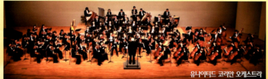
유나이티드 코리아 오케스트라

부산지역에서 활동하고 있는 피아니스트 100여명이 "Piano Grand Festival"의 자리를 마련함으로써 1명 또는 2명이 연주하는 피아노의 한계를 극복하는, 새로운 연모의 공연으로 전환을 하고자 한 무대임. 즉 무대에 여러 대의 피아노에 10여명의 출연자가 동시에 연주하여 오케스트라의 효과를 나타내고자 함.