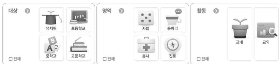
[ 1] 창의·인성교육넷의 CRM 검색창

둘째, 음악교과교육 내용에서 학부모와 지역사회의 요구를 수용할 수 있는 인터페이스를 가져야 한다. 지역교육지원청 단위에서는 학부모와 지역사회의 요구를 수용할 수 있는 인터페이스로 CRM을 작성하여 인터넷(창의·인성교육넷, http://crezone.net/index.do?todo=crm )을 통하여 전국적인 네트워크를 연결하고 있다. CRM의 경우, 지역사회의 사회·문화·역사와 관련된 장소나 시설을 발굴 소개함으로써 창의적 체험활동의 자원으로 활용하게 하고 있다. 여기에 음악교과교육에서 상당부분의 CRM 관련 소재를 제공할 수 있을 것이다. 예컨대, 음악교과교육의 내용에서 음악관련 CRM에 상당하는 소재들을 발굴하여 학습에 활용하고 소개해 하는 것이다. 이것은 20세기 종족음악학자들을 인지적 도제로 하고, 종족음악학의 방법을 활용할 수 있을 것이다.