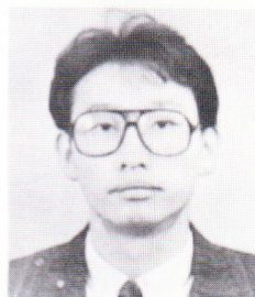
기획 : 박창화