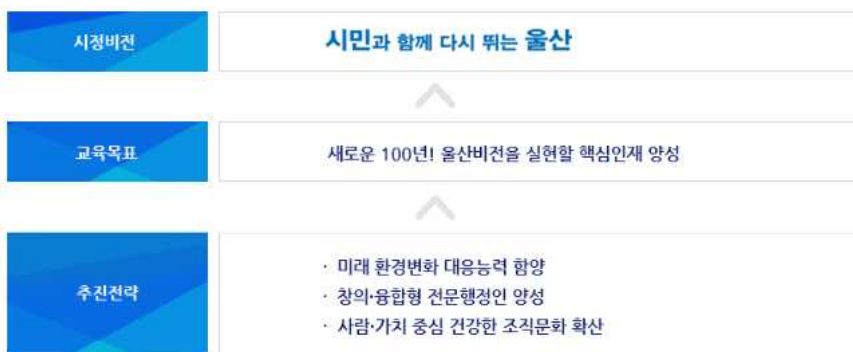
<그림 3-8> 울산광역시 2019년 교육훈련 비전 체계도