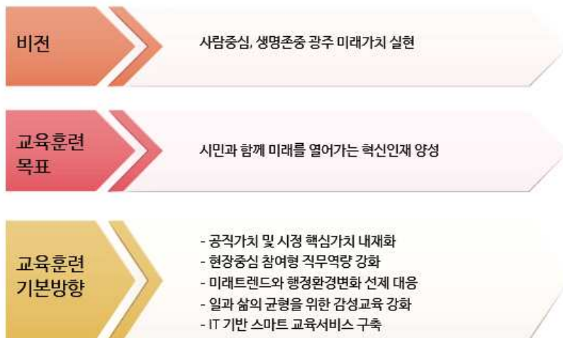
<그림 3-13> 광주광역시 2019년 교육목표