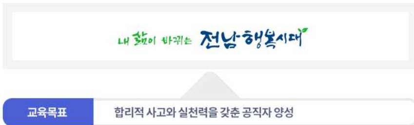
<그림 3-11> 전라남도 2019년 교육목표