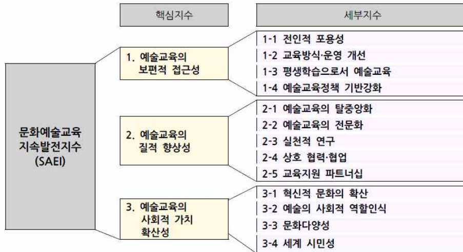
[그림 IV-1] 문화예술교육 지속발전지수(SAEI)의 구조

술교육의 사회적 가치 확산성을 제시하고 있다. 3가지 핵심지수를 기반으로 하위의 세부지수 13개를 아래 그림과 같이 제시하였다. 그 중 3. 예술교육의 사회적 가치 확산성 부분에서 ‘문화다양성’을 세부지수로 제시하고 있다.