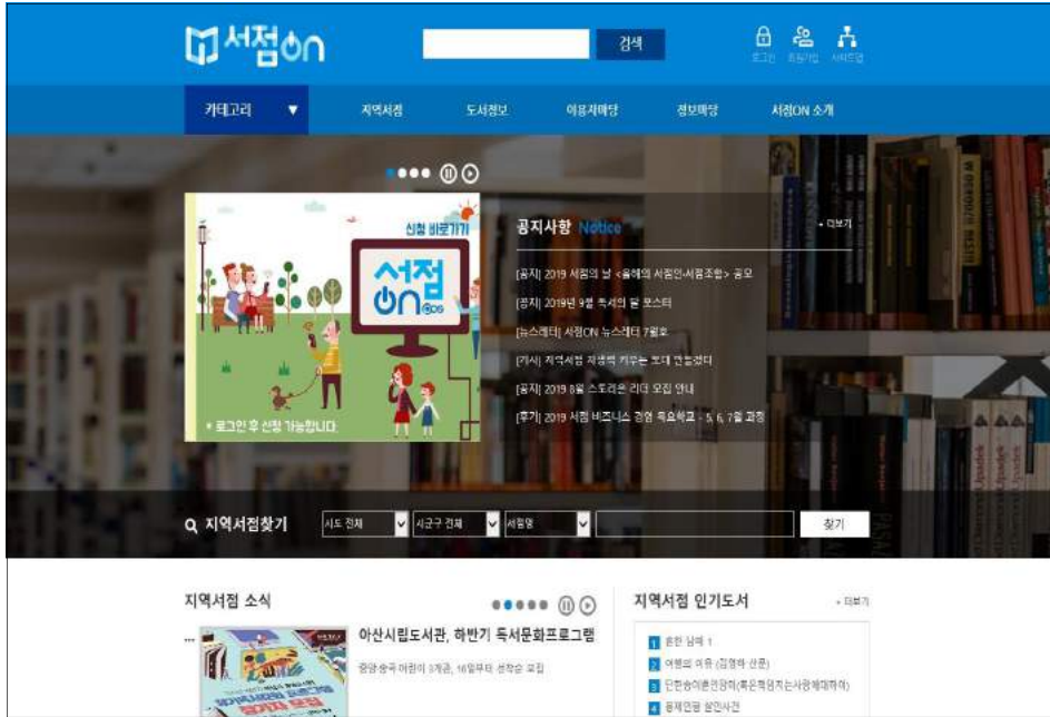
[그림 4-1] 서점ON 홈페이지