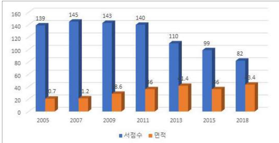
[그림 3-1] 울산의 서점수 및 면적