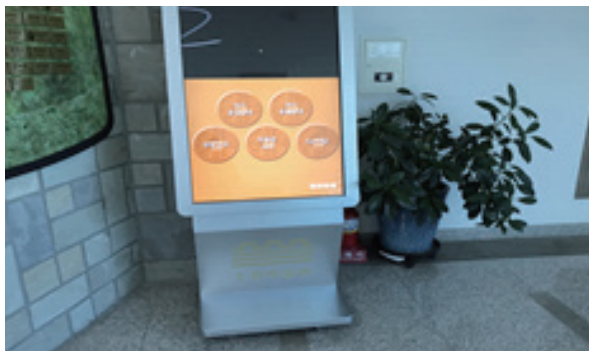
KIOSK 영상 자막 부재