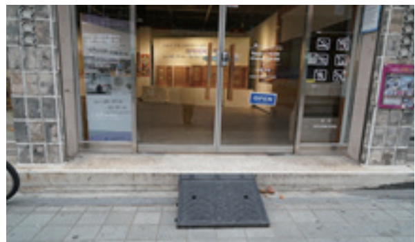
경사로가 좁고 가파름