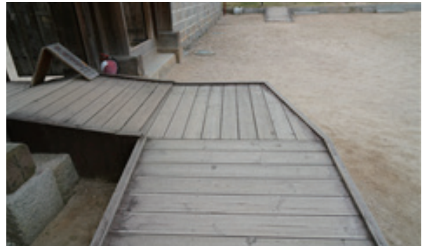
경사로가 좁고 위험함