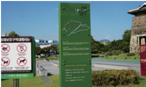
안내판의 글자가 너무 작아 읽기 어려움