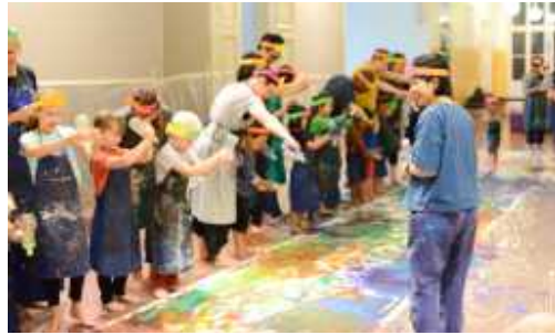
<그림 2-2> 아난딸로 아트센터 프로그램