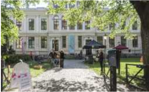
<그림 2-1> 아난딸로 아트센터 전경

교육센터 지원 사업(꿈꾸는 예술터) '을 추진하고 있으며, 지역의 유휴시설을 활용한 센터 건립의 움직임은 더욱 가속화될 것으로 예상이 됨