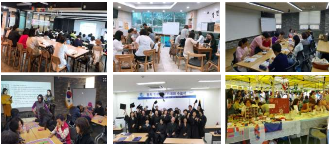
<그림 2-17> 「평생학습관」 프로그램 사례