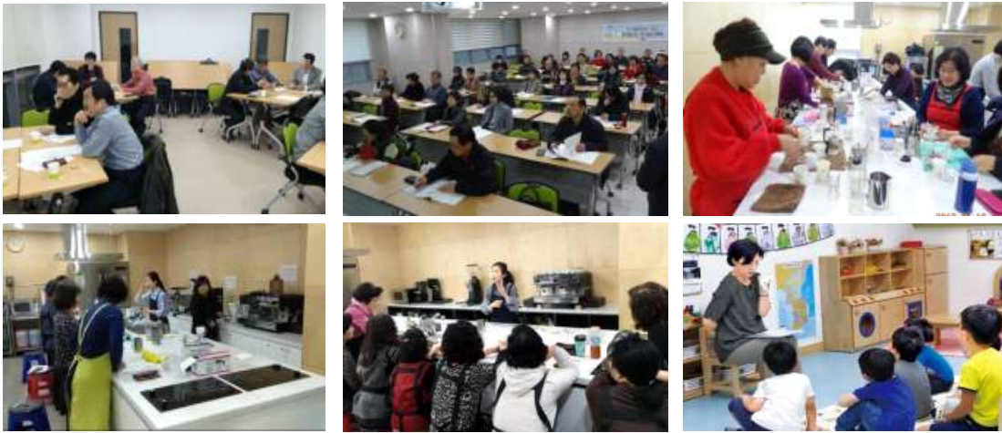
<그림 2-18> 「노인복지시설」 상담 및 프로그램, 취업 사례