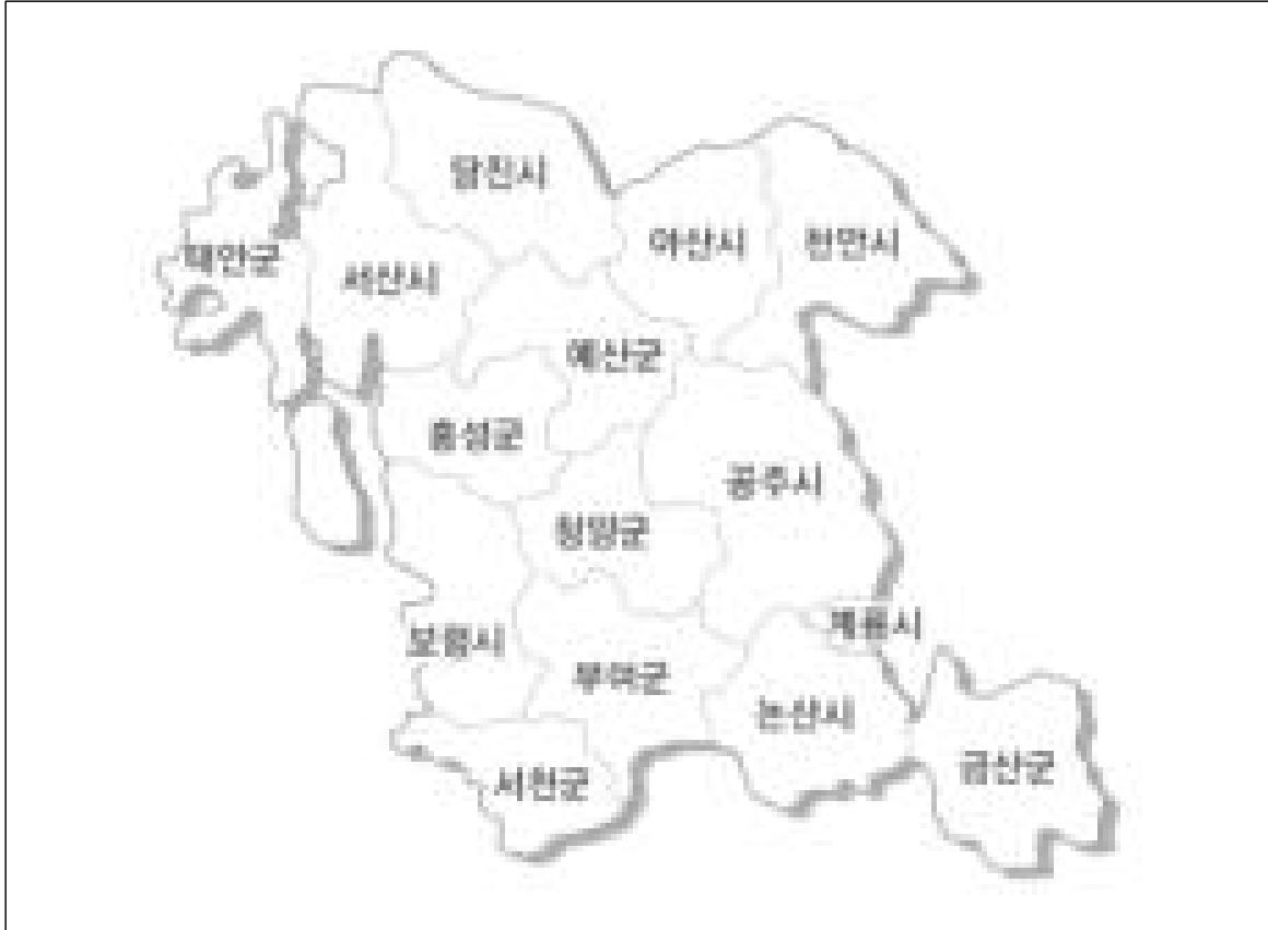
<그림 2-19> 충청남도 관내 법정동의 구분