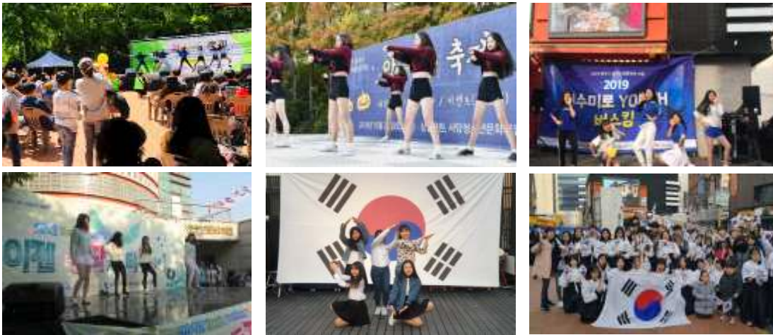
<그림 2-14> 「청소년문화의 집」 축제 및 공연활동 사례