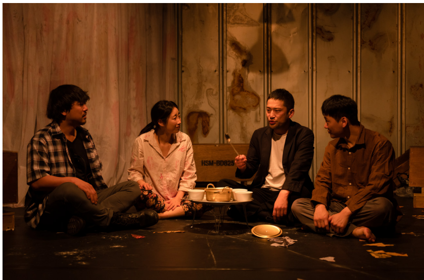
연극 <컨테이너> 공연 모습

부산에서 연극을 전공한 대학생들은 대부분 졸업을 하고 ‘대학로’로 큰 꿈을 가지고 떠난다. 꼭 예비 예술인뿐만 아니라, 현장에서 활동하고 있는 연극인들도 떠난다. 특히 젊은 연극인들이 많은 비중을 차지하고 있다. 젊은 연극인들은 부산에서 성장할 수 있는 기회가 적다고 생각하며, 좋은 작품이 창작되거나, 실력 있는 배우로 인정받더라도, 파급력이 부산 지역이라는 한정적인 곳을 뛰어 넘지 못한다고 생각한다. 하지만 부산국제공연예술마켓이 제1회 개최되면서 지역을 뛰어넘어, 서울 또는 전국이 아닌 해외로 파급력을 가질 수 있는 루트가 새로 열리게 되었다. 부산국제공연예술마켓이라는 유통플랫폼을 잘 활용하여 굳이 서울이 아니더라도 많은 부산예술 단체들의 작품이 해외로, 그리고 해외에서 다시 국내의 각 지방으로 확장되는 파급력을 가지길 기대해본다.