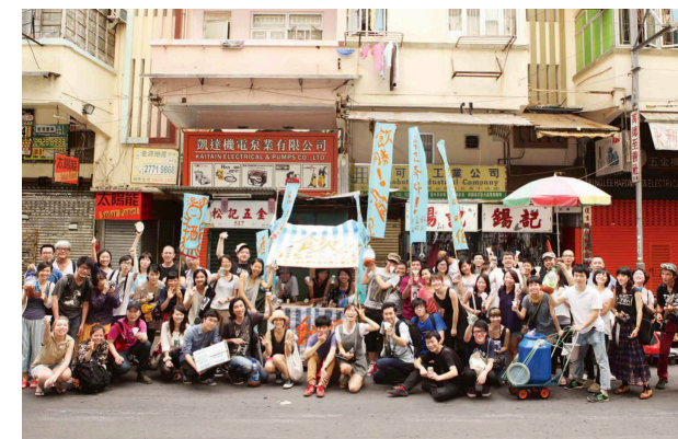
홍콩에서 열렸던 아시아 게더링. 홍콩, 한국(부산), 일본, 대만, 중국, 말레이시아, 싱가포르 등 여러 나라의 아티스트와 활동가들이 모였다.

다른 지역에서 부산으로 초대해 교류를 진행했던 것만큼 우리도 밖으로 나가려는 노력을 했다. 다른 지역을 만나는 경험은 편차가 있기 때문에 일반화시켜 풀어내기는 어렵지만 그들의 일상을 모험처럼 경험하며 차이와 공통점을 발견하는 시간이 우리가 그랬던 것처럼 그들에게도 선물이 될 수 있다는 것을 알았다. 그리고 이러한 교류의 매력은 해외에서 다른 문화권을 만났을 때 더 커진다는 것을 알았다.