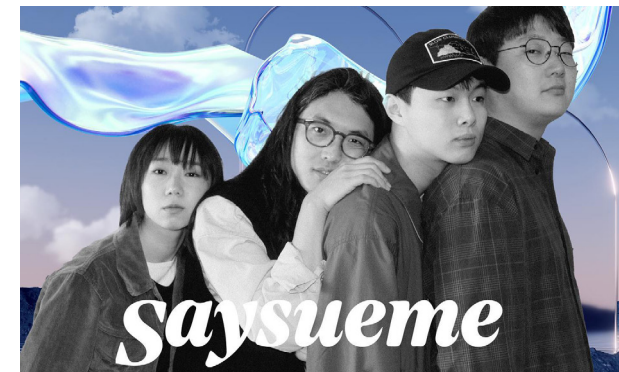
밴드 세이수미

부산을 국제적인 문화플랫폼으로 개방하고 활성화시키는 방법에 대해 다르게, 다양하게, 구체적이게, 흥미롭게 구상하고 실천하는 노력을 시작할 때가 되었다. 부산 활동을 기대하고 실천하는 여러 나라의 아티스트가 많아지는 사례와 부산에서 세상을 만나며 성장한 인력이 지역에 기반하면서도 세계 무대로 활동하는 밴드 '세이수미'와 같은 사례가 교차하면서 원심력과 구심력이 동시에 작동하는 문화플랫폼 도시. 서면과 광안리, 해운대, 사상, 영도, 대학가, 원도심 등 각 지역마다의 풍경 안에서 국제적인 경계를 넘나드는 활동이 일상화 된 도시 부산. 생태계가 확장되고 여러 나라의 아티스트들도 목표를 실현할 수 있는 가능성이 있는 도시 부산. 단지 꿈일 뿐인가? 아니면 우리가 충분히 지향하고 만들어갈 수 있는 목표인가?