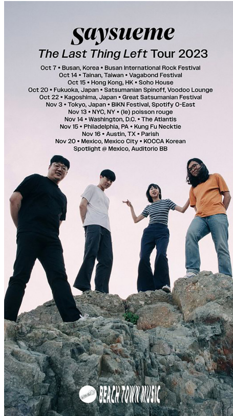
밴드 세이수미 2023년 월드투어 일정