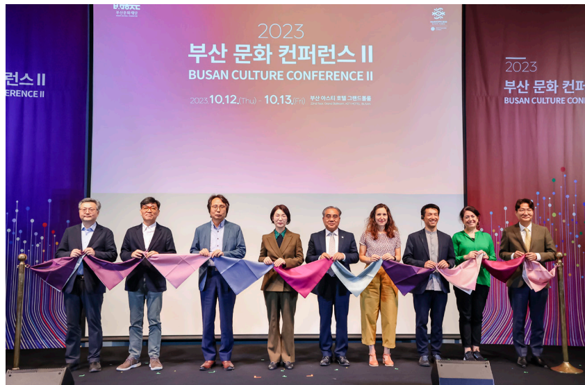
2023 부산문화컨퍼런스 II

그간 우리의 도시는 국가라는 대분류 속 중분류 속 어딘가에 자리잡고 있었던 것 같다. 그러나 세계적으로 도시의 규모는 지속적인 팽창을 거듭하고 있다. 도시의 매력 또한 하나로 귀결될 수 없는 복잡성을 가지고 있으며, 살아있는 유기체인 도시는 이 곳을 살아가는 이들에 의해 끊임없이 진화하고 있다. 점점 커져가고 자체적인 생명력을 확보해가는 부산이라는 도시는 여러 동료 도시와의 소통을 통해 스스로의 매력과 특징을 발견해갈 수 있을 것이다. 이러한 소통의 과정은 특정 주체에게만 독점되는 것이 아니라 도시 안의 다양한 주체 모두에게 열린 기회여야 한다. 부산을 더 나은 삶터로 진화시키기 위한 다양한 여정에 도시를 살아가는 모든 이들이 함께 할 수 있도록 정책적 진화가 필요하다.