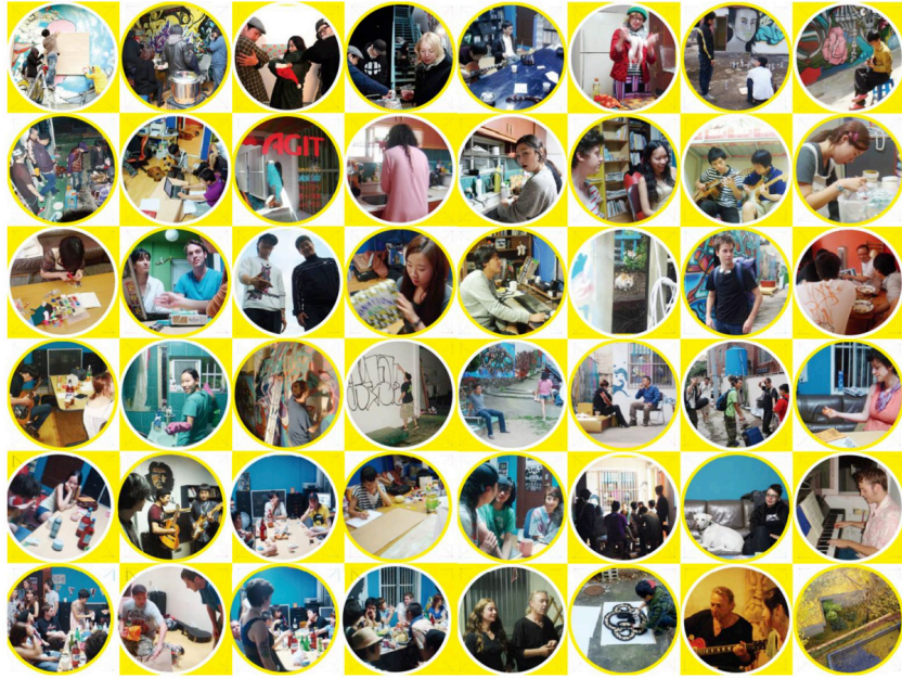
독립문화공간 AGIT의 게스트하우스 풍경

나의 부산 기억에서 교류 기반의 활동 비중은 상당했다. 함께 일하던 동료들과 쪽방 같은 사무실을 사용할 때에도 그 작은 공간을 함께 나누며 여러 지역의 사람들과 부산을 여행했고, 우리가 부산의 안내자가 되어준 만큼 그들도 문을 열어 새로운 세상으로 우리를 초대했다. 부족한 언어도 소통의 지 앞에서 충분히 극복할 수 있었고, 교류가 빈번해지자 대부분의 주변 사람들이 기본적인 언어 소통 능력을 장착하게 되는 변화까지 생겼다. 쪽방에서 벗어나 처음으로 제대로 된 공간을 만들 때 가장 먼저 확정한 것이 게스트하우스였다. 다른 도시를 방문했을 때 체류할 곳을 찾기 어려웠던 경험이 있어서 다른 지역의 아티스트들이 부산을 조금 더 편하게 방문할 수 있도록 스스로 아티스트라고 규정하는 사람이라면 누구든 받아들일 준비를 하고 시작했던 게스트하우스는 열린 공간 하나를 통해 얼마나 넓은 세상을 만날 수 있는지를 확인시켜 주었다. 환영해주고 함께 자고 먹는 노력만으로도 그들이 얼마나 부산에 대해 큰 호감을 가지게 되는지 알았다. 그 호감이 서로의 세상을 연결하는 힘이 되고, 새로운 작업의 가능성과 작업을 선보일 더 넓은 세상을 약속하게 해 준다는 것도 알았다.