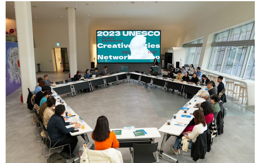
2023 유네스코 창의도시 워크숍

네트워크의 장점 중 함께 하는 홍보일 것이다. 네트워크를 통해 형성된 관계망을 통해 각 도시의 시민들이 함께 할 수 있는 이벤트들을 구현하는 것 역시 네트워크를 강화하고, 적극적 참여를 이끌어낼 수 있는 방법이기 때문이다. “부산국제어린이청소년영화제 포스터 공모전”이 한 사례가 될 수 있을 것 같다. 매년 개최되는 부산국제어린이청소년영화제 포스터에 들어갈 그림들을 영화창의도시 네트워크를 활용해 각 도시에서 공모를 받고, 시상하는 제도를 시행하고 있다. 이처럼 네트워크망을 통해 공동의 홍보를 수행하고 같이 참여하는 이벤트의 개발 역시 적극적인 네트워킹을 위해 필요할 것이다.