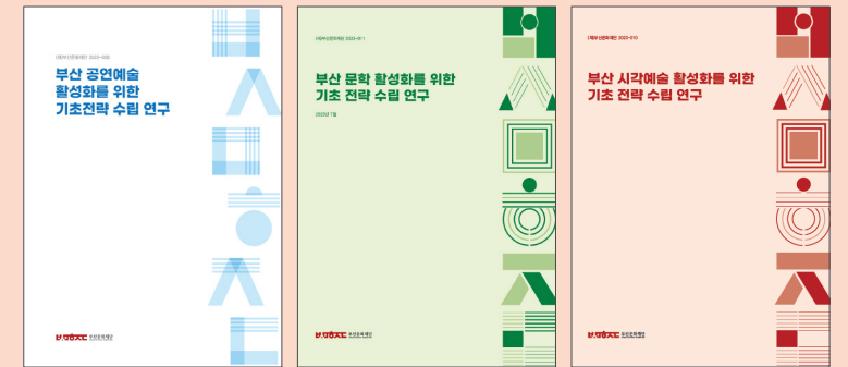
부산문화재단 정책연구센터의 보고서(문학, 공연예술, 시각예술 관련)

이렇게 악화되고 있는 예술창작 환경이라는 근본과제를 염두에 두고서, 세 건의 연구보고서는 예술 활성화 지원에 필요한 소요 예산도 고려하여 현실적이면서도 세부적인 제안을 하고 있는데, 그 내용과 구체성에서 그동안 연구원들이 들었을 시간과 노력이 느껴질 정도로 꼼꼼하게 정리되어 있다. 제안된 정책과제들은 장기적 문제의식의 기반하에 구체적인 실행 가능성을 고려하고 또 현장의 의견을 반영하여 제안된 정책과제들로서 관심 있는 분들의 일독을 권한다.