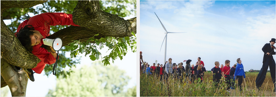
2021 season for change 참여 프로그램