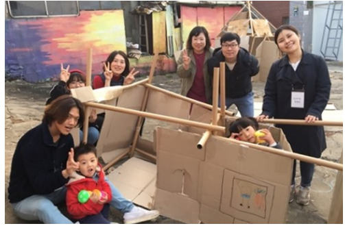
부산문화재단 반딧불이 프로그램