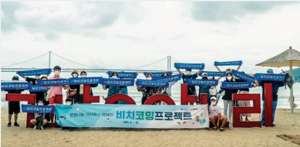
2021 비치코밍 프로젝트