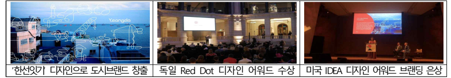
<사례> 문화도시 영도: '한선 잇기' 도시 브랜드로 세계 디자인 어워드 3관왕 수상