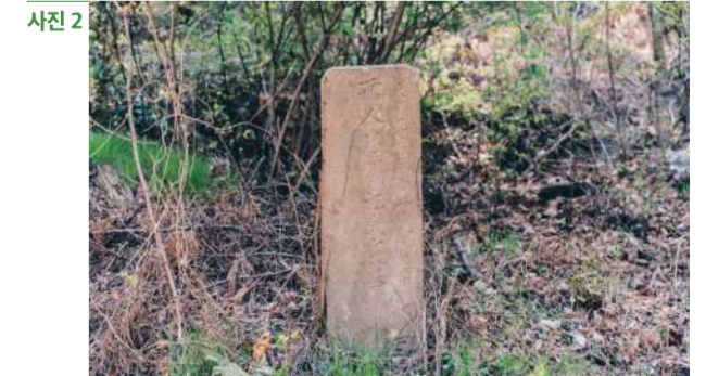
사진 1 봉래산 360 둘레길 코스 안내도 사진 2 청학동 둘레길에서 만난 오래된 돌비석