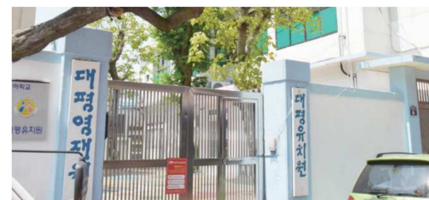
옛 대평유치원과 대평동 마을회관

그 뒤로 60년 이 넘도록 1층은 유치원, 2층은 마을회관 으로 지냈다. 거기 모여서 마을회 의하고 잔치도 하고. 또 체력단련장 도 맨들어서 사람들이 들나날락 했지. 대평동 아들 중에 여기 모르는 사람 없을 걸. 여기서 주민들 다 쟁기고, 뭐라도 있으면 다 노나 멕이고 그랬다. 그래, 인자 와서 보이, 그 긴 세월 속에 사람들의 애환이 옥수로 묻어있는 곳 아니겠다.