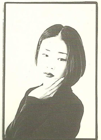
안무 - 김윤정