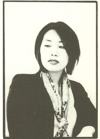
안무 - 신호영