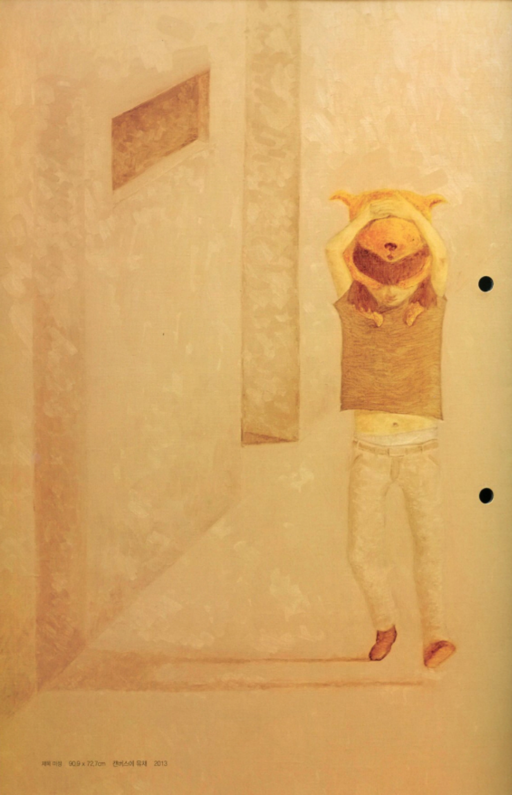
제목 미명 90.9 x 72.7cm 캔버스에 유채 2013