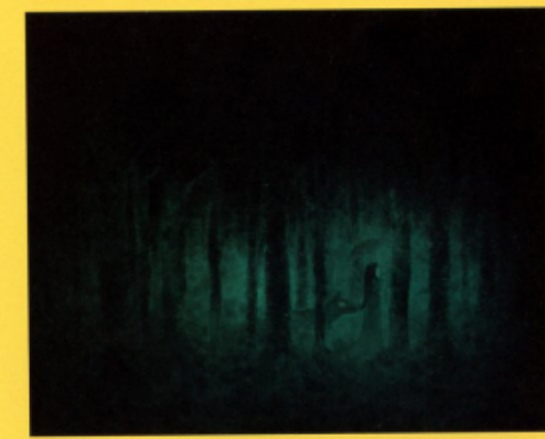
이끼진 숲 속을 거니는 우산을 쓴 애가씨와 그를 지키는 북대가제 100 x 80.3cm 캔버스에 유채 2013