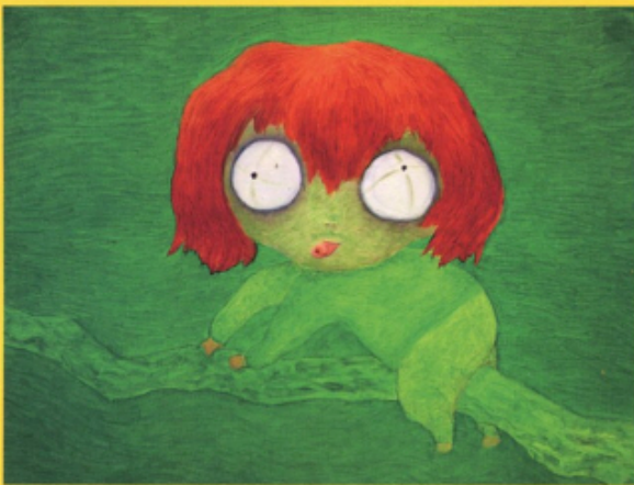
▲ 배의 미장 90.9 x 72.7cm 캔버스에 유채 2013