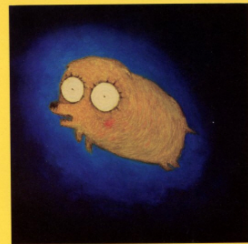
레몬을 보고 실어떨던, 갑자기 두 눈을 뜨게된 고구마 두더지 가제 90.9 x 90.9cm 캔버스에 유채 2013