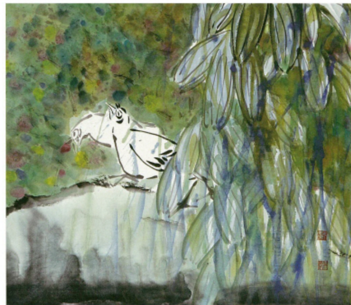
동행 - III · 55×48cm