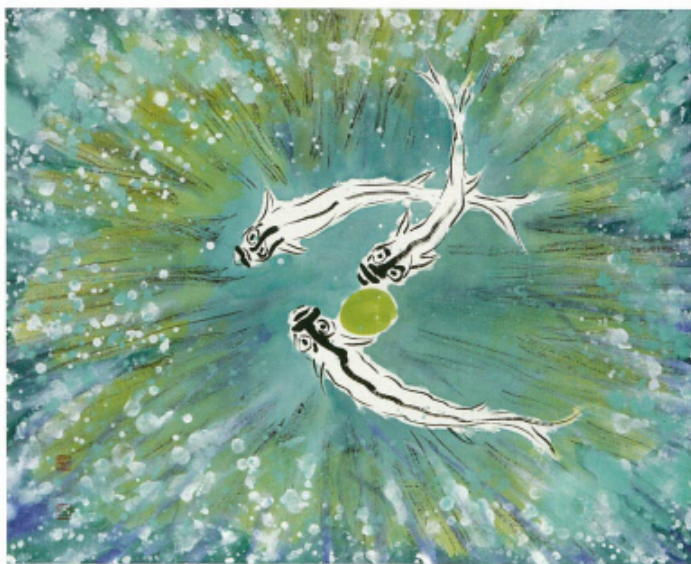
어락 - II - 52×42cm