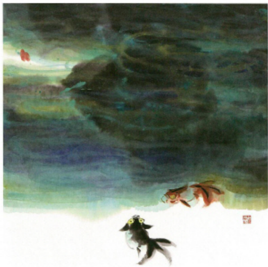
어락 - I - 48×55cm