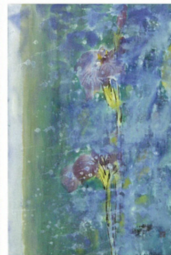
꽃망 · 28×42cm×2