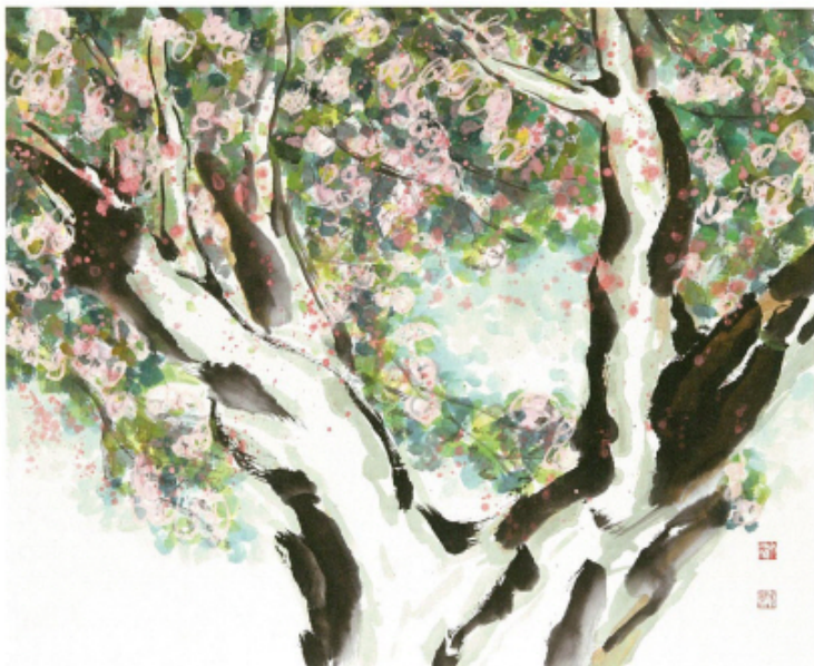
봄이 오는 소리 · 69×55cm