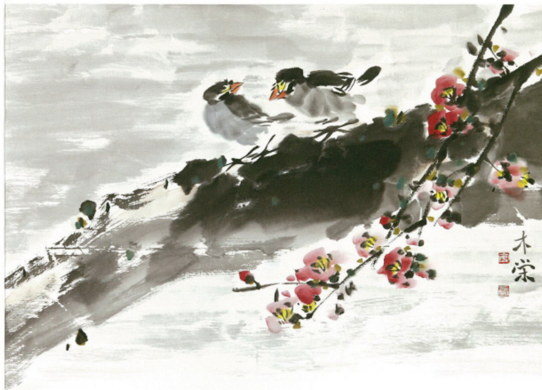
동행 - I - 57×48cm