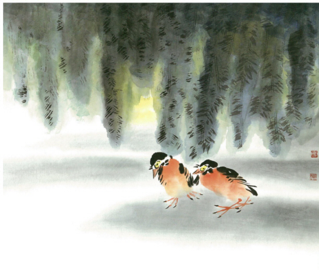
동행 - I · 48×55cm