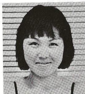
한 은 주

* 이 공연을 위하여 찬조 출연해 준 현대무용단 주 - □ 단원들에게 진심으로 감사드립니다.