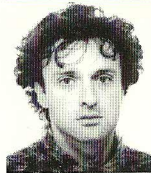
프랑스와 라스칼루 (프랑스 라스칼루남 무용단)