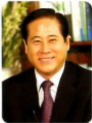
부산광역시 해운대구청 구청장 배덕광

유난히도 길고도 무더웠던 2013년의 여름을 밀어내고 아침저녁 불어오는 시원한 바람이 완연한 가을임을 느끼게 합니다.