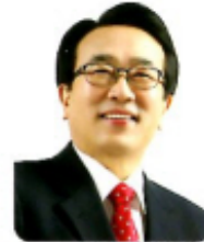
해운대구 기장군(갑) 국회의원 서병수

'해운대 달맞이 민속보존회 - 제30주년 옛날전통 민속놀이 정기공연' 개최를 진심으로 축하드립니다.