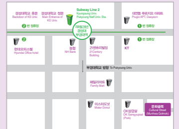
BIPAF ZONE 위치(Venue)