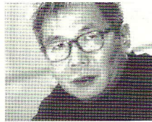
연출·무대미술 윤정섭 (한국예술종합학교 연극원 교수)