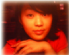
조명오피 - 정미소