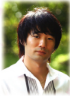
연출 - 최재민